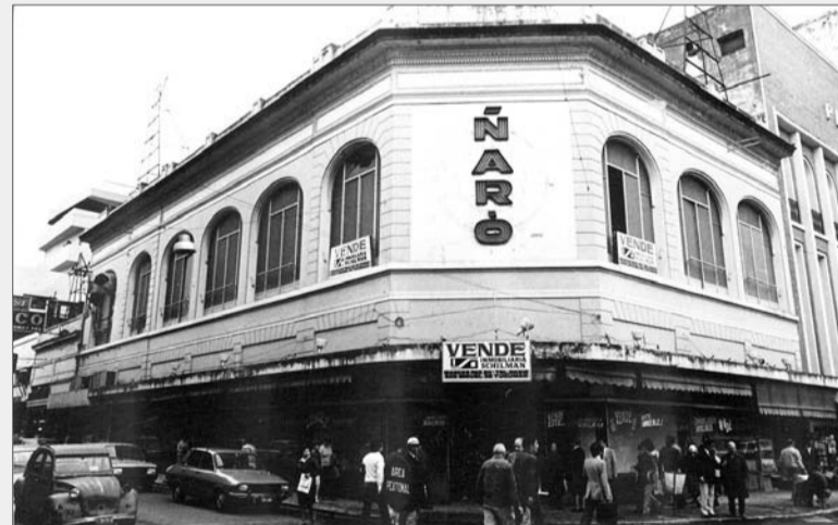
LOS ÚLTIMOS TIEMPOS. Aspecto de la esquina 25 de Mayo y San Martín en 1983, cuando ya "Ñaró" había cerrado y el edificio estaba en venta.

blema de la casa. Su perfil constituía el logotipo y también estaba colocada, en gran tamaño y con luces de neón, en lo alto de la fachada, sobre la esquina.